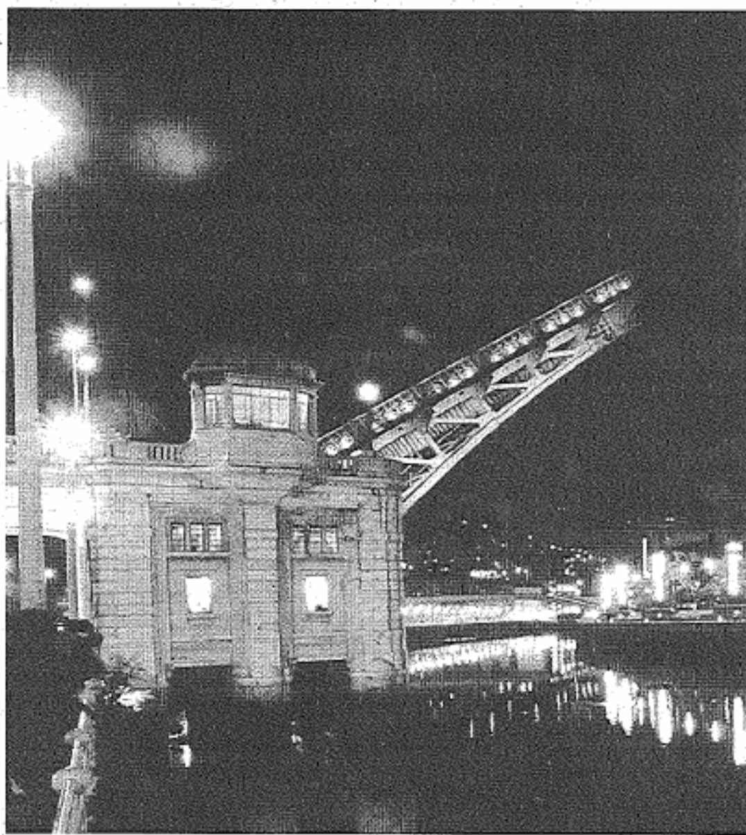
NOCTURNO. El Puente de Deusto abre sus brazos.