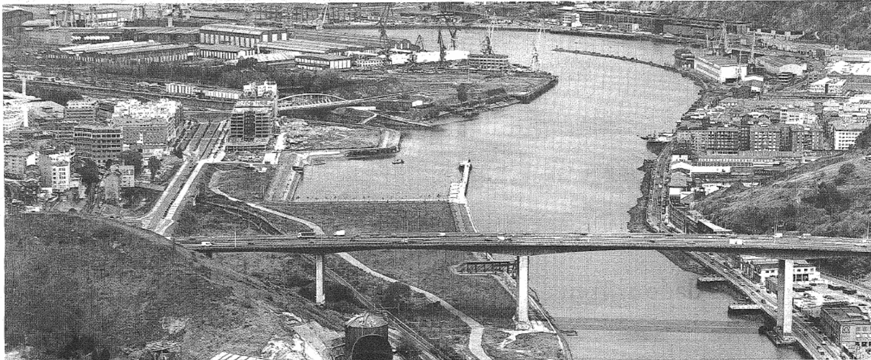
ESTRATÉGICO. El puente de Rontegi, que soporta un tránsito de 130.00 vehículos diarios, es hoy el único nexo viario entre las dos márgenes de la ría.