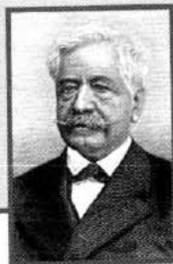
Ferdinand de Lesseps, ingeniero del Canal de Suez, fracasó estrepitosamente en el proyecto de Panamá.

Gobierno negociaba con Bolivia la independencia de Panamá y firmaba con la nueva república el tratado Hay-Bunau Varilla por el que Panamá cedía a perpetuidad el dominio sobre el Canal a Estados Unidos. El 15 de agosto de 1914 el vapor Arcón inaugura el istmo. El negocio de transporte de granos y petróleo es todo un éxito, pero la prosperidad comercial pasa del largo por el país centroamericano, ya que EEUU apenas paga 250.000 dólares al año. Después de años de protestas, el 31 de mayo de 1999 se firma el tratado Torrijos-Carter. Por fin, Panamá pasa a ser dueña de su propio canal y su negocio.